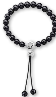
Pulsera star Mont Blanc