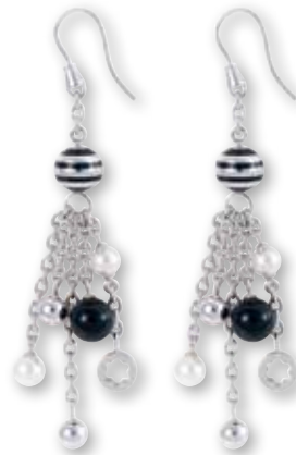
Aretes Star Mont Blanc