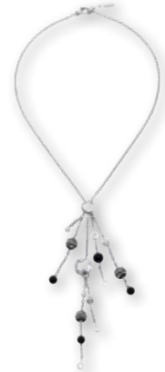
Collar Star Mont Blanc